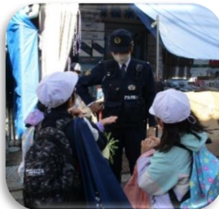
巡回中のおまわりさんにお買い物の報告