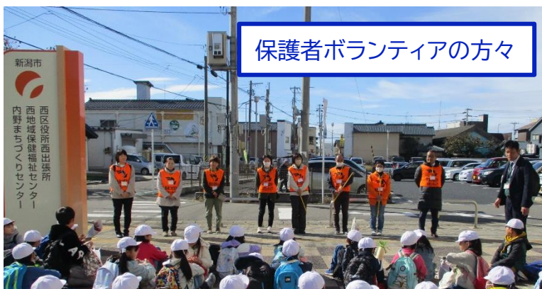
保護者ボランティアの方々