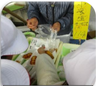
子ども用に個別販売