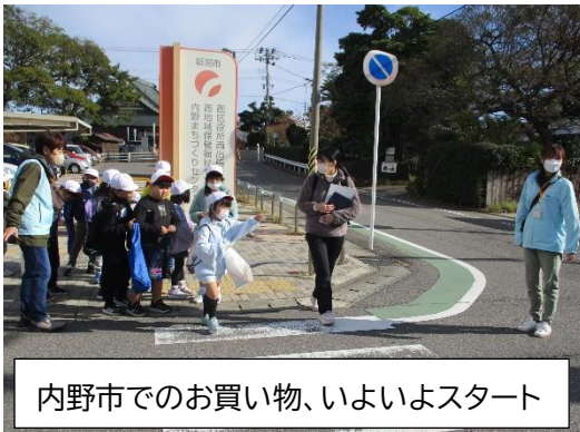
内野市でのお買い物、いよいよスタート

お天気に恵まれ温かい日差しの中、子どもたちの活動を温かく見守ってくださり本当にありがとうございました。